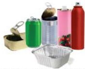
Tous les emballages métalliques (conserves, canettes, aérosols, bidons, barquettes...)