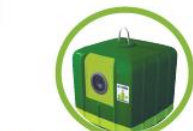
Le verre se recycle à l'infini ... dans les colonnes à verre