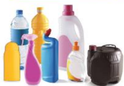
Les bouteilles, flacons et bidons en plastique